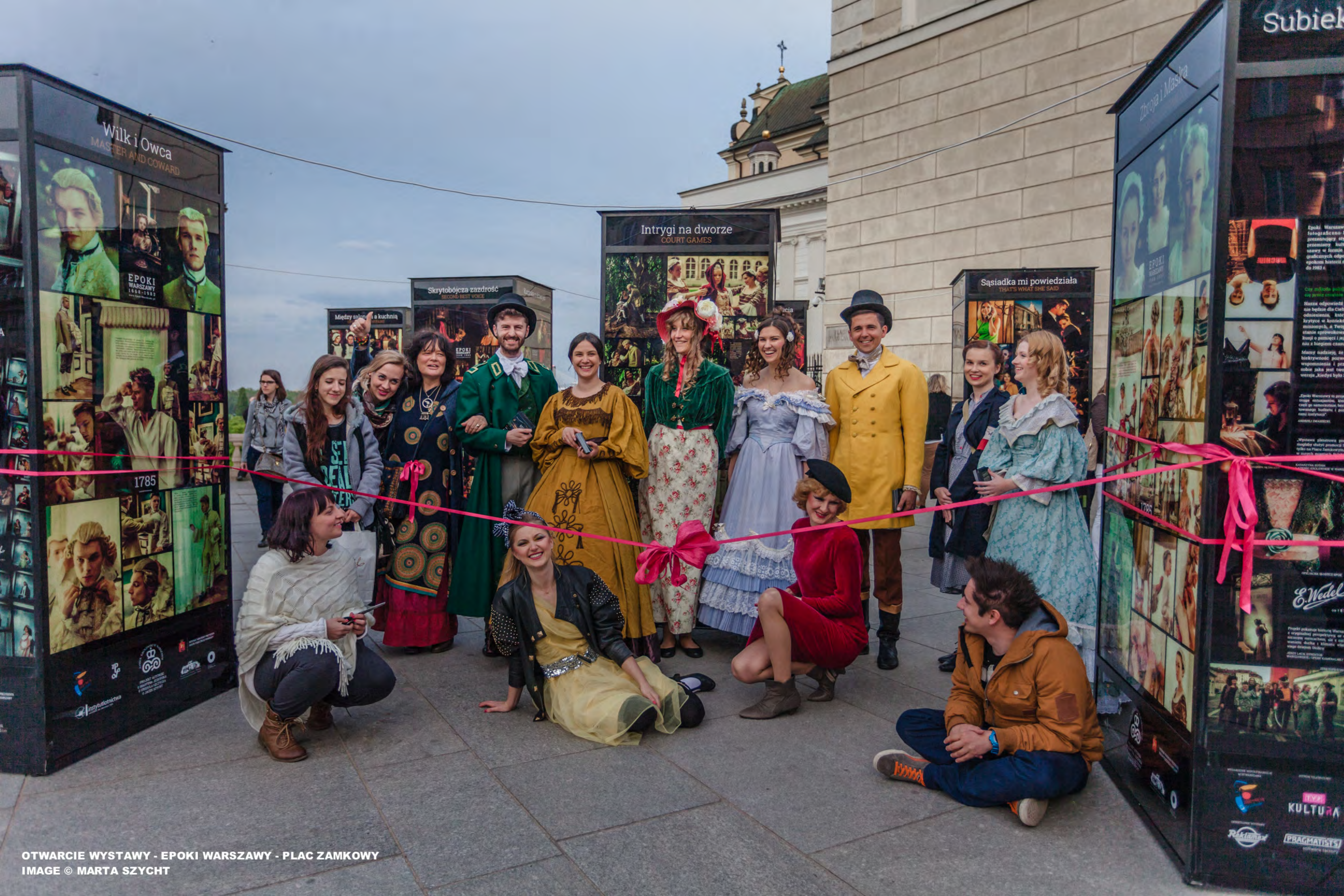
OTWARCIE WYSTAWY - EPOKI WARSZAWY - PLAC ZAMKOWY